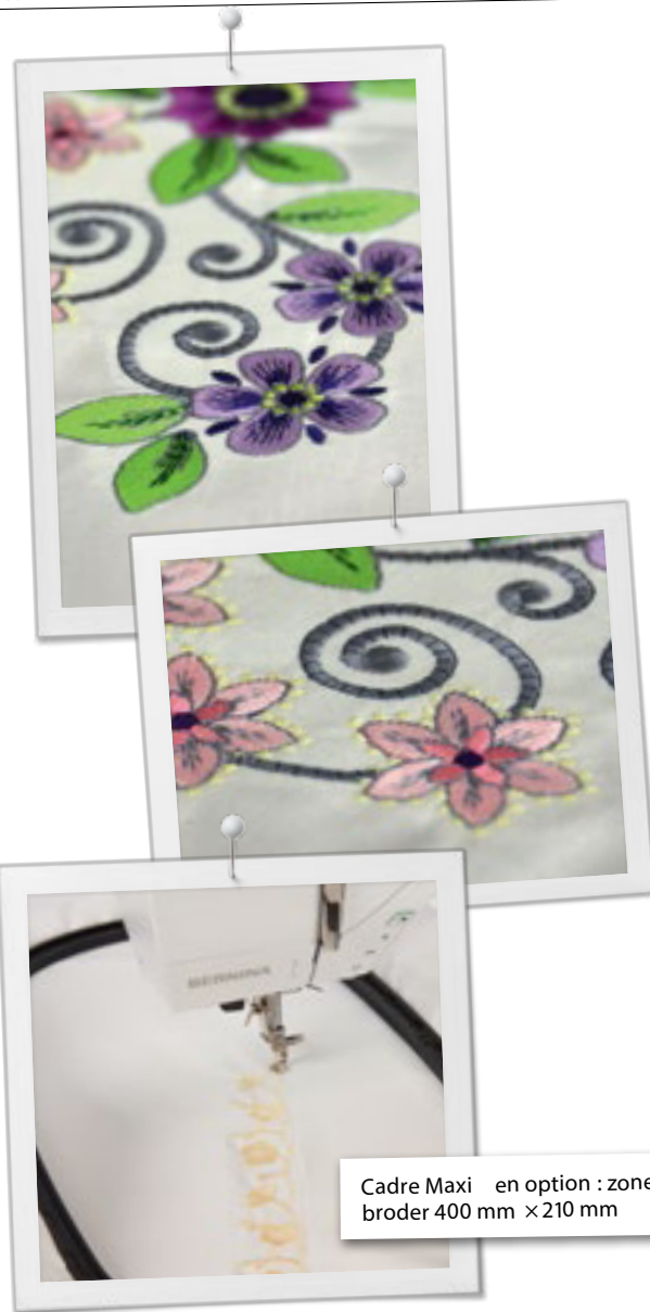
Cadre Maxi en option : zone à broder 400 mm × 210 mm