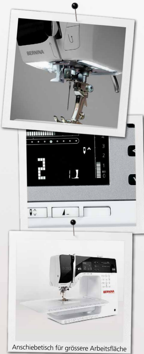
Anschlagetisch für grössere Arbeitsfläche

Mehr über die BERNINA 3er Serie erfahren und kostenlos die Anleitung zum Party-Outfit herunterladen: www.bernina.com/3series .